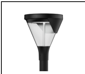
SKVER Backshield RAL9005 (435515)