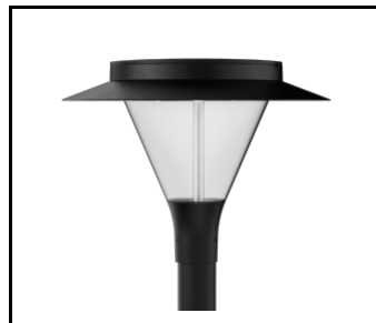
SKVER Reflektor Muster 1 RAL9005 (435522)