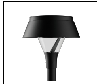
SKVER Reflektor ULR Muster 2 RAL9005 (421518)

Erstellungsdatum der Karte: 21 October 2024