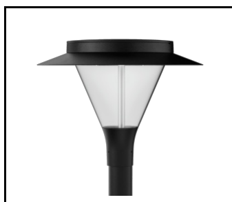
SKVER Reflektor Muster 1 RAL9005 (435522)