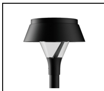
SKVER Reflektor ULR Muster 2 RAL9005 (421518)

Erstellungsdatum der Karte: 21 October 2024