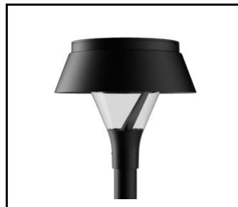
SKVER Reflektor ULR Muster 2 RAL9005 (421518)

Erstellungsdatum der Karte: 21 October 2024