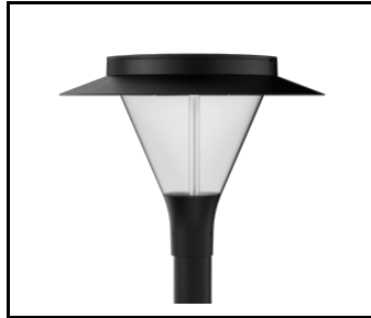
SKVER Reflektor Muster 1 RAL9005 (435522)

Erstellungsdatum der Karte: 21 October 2024