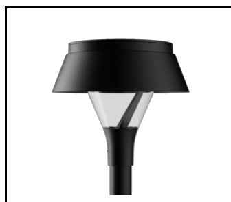
SKVER Reflektor ULR Muster 2 RAL9005 (421518)

Erstellungsdatum der Karte: 21 October 2024