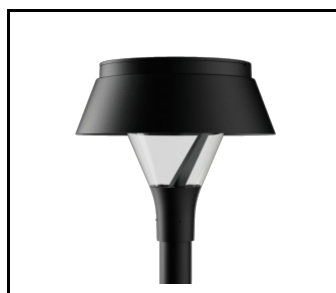
SKVER Daszek ULR wzór 2 RAL9005 (421518)