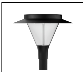
SKVER Daszek wzór 1 RAL9005 (435522)