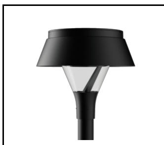
SKVER Daszek ULR wzór 2 RAL9005 (421518)