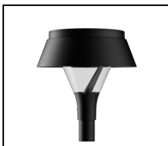
SKVER Daszek ULR wzór 2 RAL9005 (421518)