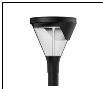
SKVER Backshield RAL9005 (435515)