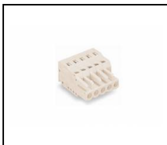
ELEGANTE SYSTEM LED gniazdo 5 polowe (388750)