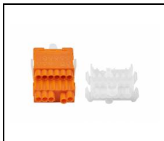
LINEA S LED zestaw zasilający 11P (981388)