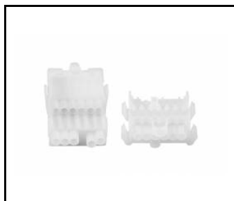
LINEA S LED zestaw zasilający 5P (980084)