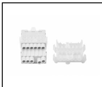
Linea S LED zestaw zasilający 7P (980978)