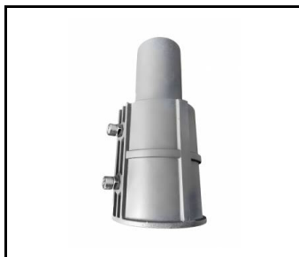
Uchwyt regulowany Astra LED/Astra LED BASIC aluminium szary RAL 9006 fi 64mm Corona 2 led (UL00214)

Data utworzenia karty: 22 październik 2025