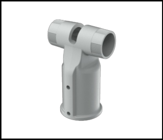
TIARA 2 LED Support réglable Dark Sky diamètre 64 mm gris (804625)