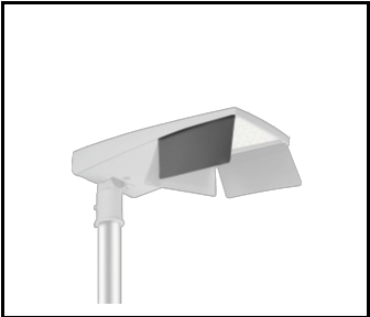
Coupe-flux latéral P (droit) Tiara 2 LED M (UL00959)