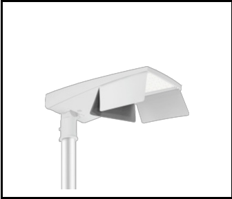
Coupe-flux arrière T Tiara 2 LED M RAL9006 (MOQ 80szt.) (UL00958)