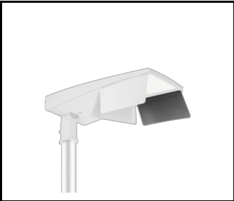
Coupe-flux latéral L (gauche) Tiara 2 LED M (UL00960)