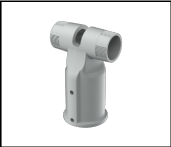
TIARA 2 LED Support réglable Dark Sky diamètre 64 mm gris (804625)