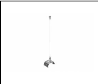
LINEA S LED-Hängeleuchte 1.5m (981173)