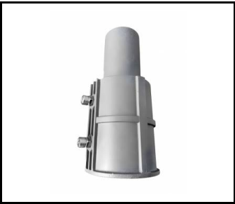
Support réglable Astra LED/Astra LED BASIC aluminium gris RAL 9006 fi 64 mm Corona 2 LED (UL00214)

Date de création de la carte: 05 février 2024