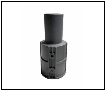
Adaptateur pour poteau 80/60 ALU (598357)