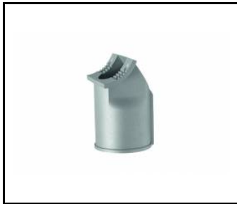
Halterung 78 mm (UL00229)

Erstellungsdatum der Karte: 05 Februar 2024