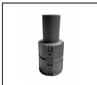
Adaptateur pour poteau 80/60 ALU (598357)