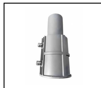
Uchwyt regulowany Astra LED/Astra LED BASIC aluminium szary RAL 9006 fi 64mm Corona 2 led (UL00214)

Data utworzenia karty: 29 październik 2025