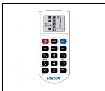
Pilot do programowania RC HAI HD05R do HD0406VRH IoT (WSEL431)

Data utworzenia karty: 29 październik 2025