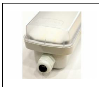
Blindstopfen für M16-Kabelverschraubung verschiedene PA schwarz M-16 – BPM-21 (60000006)

Erstellungsdatum der Karte: 09 Januar 2025