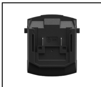
Adapter do Magnum Akku BOSCH / Hikoki 18V (NEU) (608858)

Erstellungsdatum der Karte: 23 Januar 2024