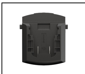
Adapter do Magnum Akku BOSCH / MIL - DEW (NEU) (608803)