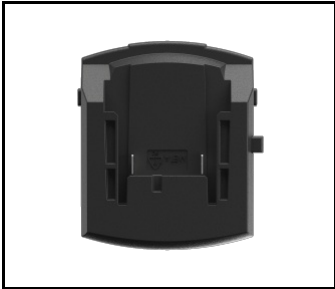
Adapter für Magnum Akku BOSCH / METABO (NEU) (608841)