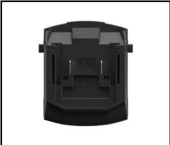
Adapter do Magnum Akku BOSCH / Hikoki 18V (NEU) (608858)

Erstellungsdatum der Karte: 23 Januar 2024