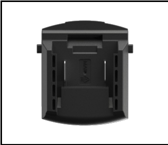
Adapter für Magnum Akku BOSCH / MAKITA (NEU) (608810)