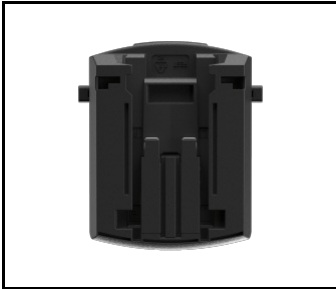
Adapter für Magnum Akku BOSCH / FESTOOL (NEU) (608827)