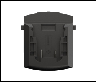
Adapter do Magnum Akku BOSCH / MIL - DEW (NEU) (608803)