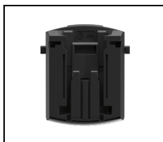
Adapter do Magnum Battery BOSCH / FESTOOL (NEW) (608827)