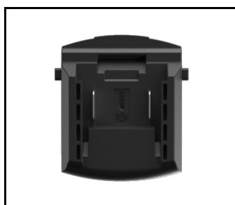
Adapter do Magnum Battery BOSCH / MAKITA (NEW) (608810)