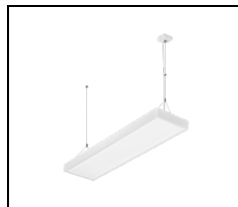
CONTRA LED-Pendelsystem 1200x300 (374692)