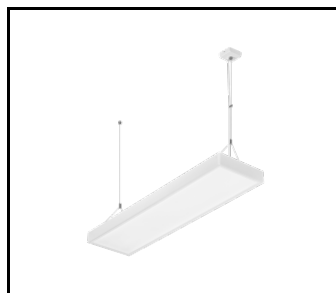
CONTRA LED závěsný systém 1200x300 (374692)