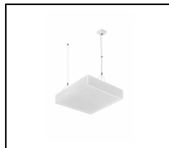
Závěsný systém CONTRA LED 600x600 (374685)