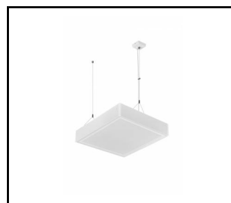
Závěsný systém CONTRA LED 600x600 (374685)