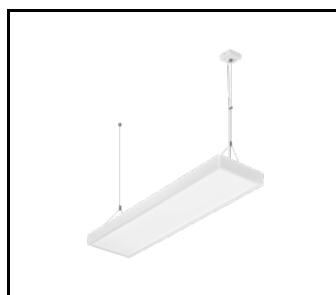
CONTRA LED závěsný systém 1200x300 (374692)