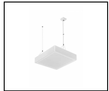
Système de suspension CONTRA LED 600x600 (374685)