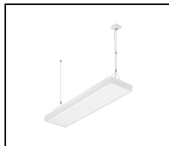
CONTRA LED-Pendelsystem 1200x300 (374692)