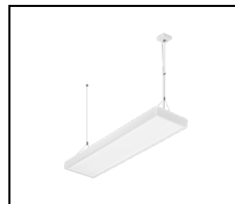
CONTRA LED-Pendelsystem 1200x300 (374692)