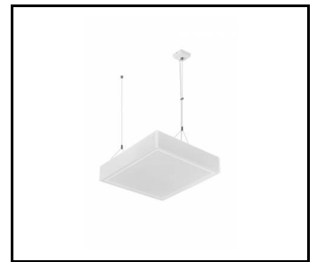
CONTRA LED-Pendelsystem 600x600 (374685)