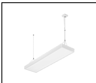
CONTRA LED system zwieszania 1200x300 (374692)