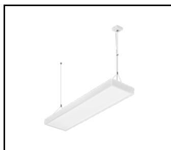
CONTRA LED system zwieszania 1200x300 (374692)