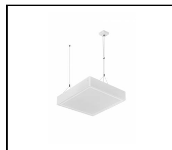
CONTRA LED system zwieszania 600x600 (374685)