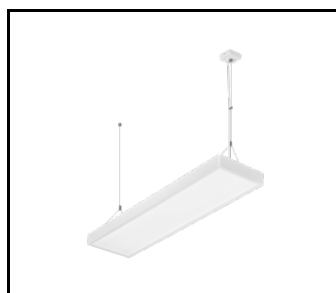
CONTRA LED system zwieszania 1200x300 (374692)