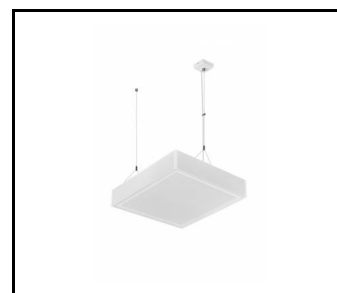
CONTRA LED system zwieszania 600x600 (374685)