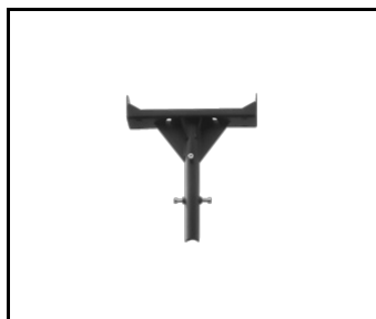
Support de montage pour les lampes LED Illuminator (16000154)

Date de création de la carte: 04 décembre 2023