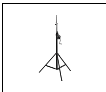
Stahlständer 4.3 m (608773)