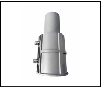
Support réglable Astra LED/Astra LED BASIC aluminium gris RAL 9006 fi 64 mm Corona 2 LED (UL00214)

Date de création de la carte:12 septembre 2023