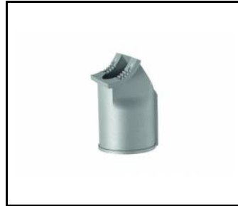
support de montage 78 mm (UL00229)

Date de création de la carte: 12 septembre 2023