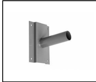
Wandhalterung- grau (314056)