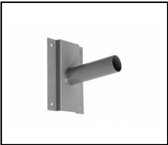
Wandhalterung- grau (314056)