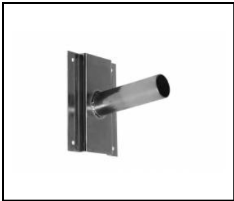
Wandhalterung- verzinkt (314049)