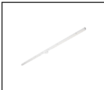
Držák Linea S LED pro povrchovou montáž (980954)