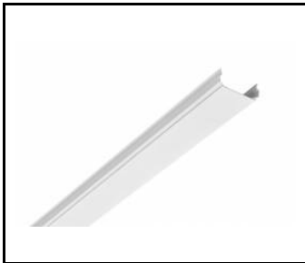
LINEA S LED - Blende PVC 1764mm (981159)