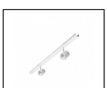
LINEA S LED 588mm AW DOT CSO 2W 1h NM AT (981241)