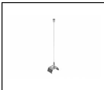
LINEA S LED- maskownica metalowa 1176mm (980947)