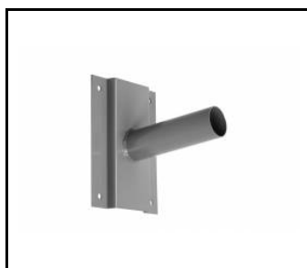
Wandhalterung- grau (314056)

Erstellungsdatum der Karte: 21 November 2024