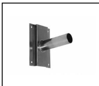
Wandhalterung- verzinkt (314049)