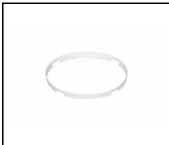
Dione LED stropní prstenec ocelový 1.5 bílý matný RAL 9003 lakovaný odolný proti vandalismu (120DL118)