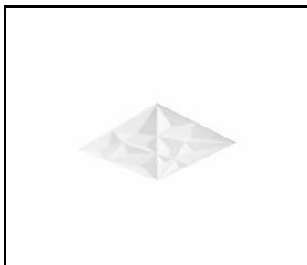
Stínidlo TRIPACT (658372)