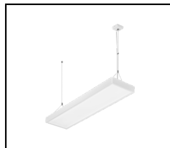
CONTRA LED závěsný systém 1200x300 (374692)