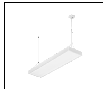
CONTRA LED závěsný systém 1200x300 (374692)