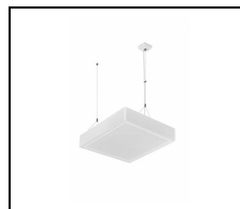
Závěsný systém CONTRA LED 600x600 (374685)