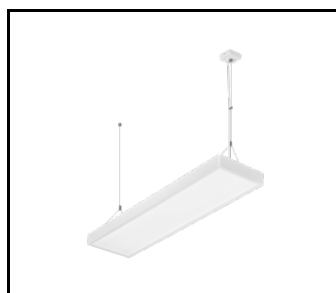
CONTRA LED závěsný systém 1200x300 (374692)