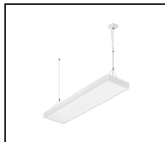
CONTRA LED závěsný systém 1200x300 (374692)