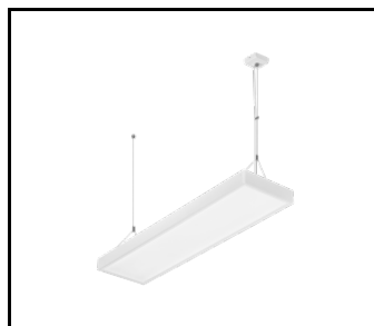
CONTRA Système de suspension LED 1200x300 (374692)