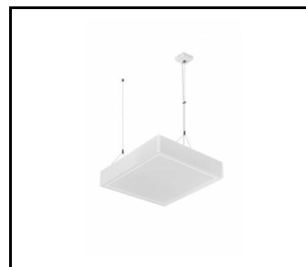
Système de suspension CONTRA LED 600x600 (374685)