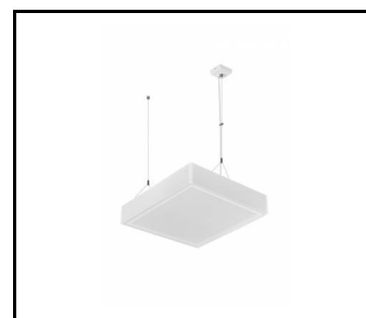
Système de suspension CONTRA LED 600x600 (374685)