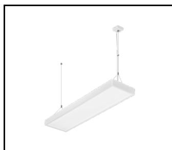
CONTRA Système de suspension LED 1200x300 (374692)